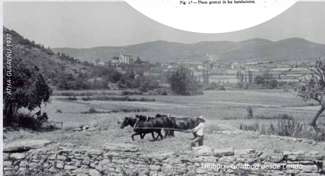
Ullibarri-Gamboa desde Landa